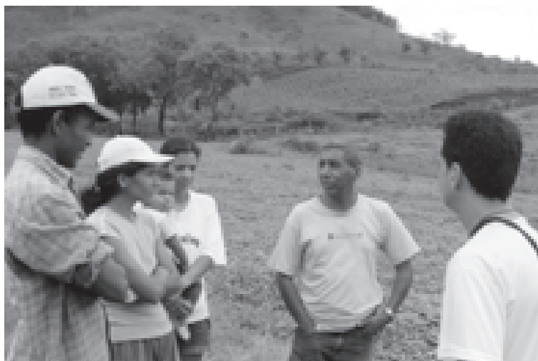
Agricultores de Araponga (MG) envolvidos com a experiência de compra coletiva de terras

Assim como os três exemplos apresentados, mais de trezentas experiências, desenvolvidas na Amazônia, na Mata Atlântica e em seus ecossistemas associados, recebem ou já receberam apoio do PDA.