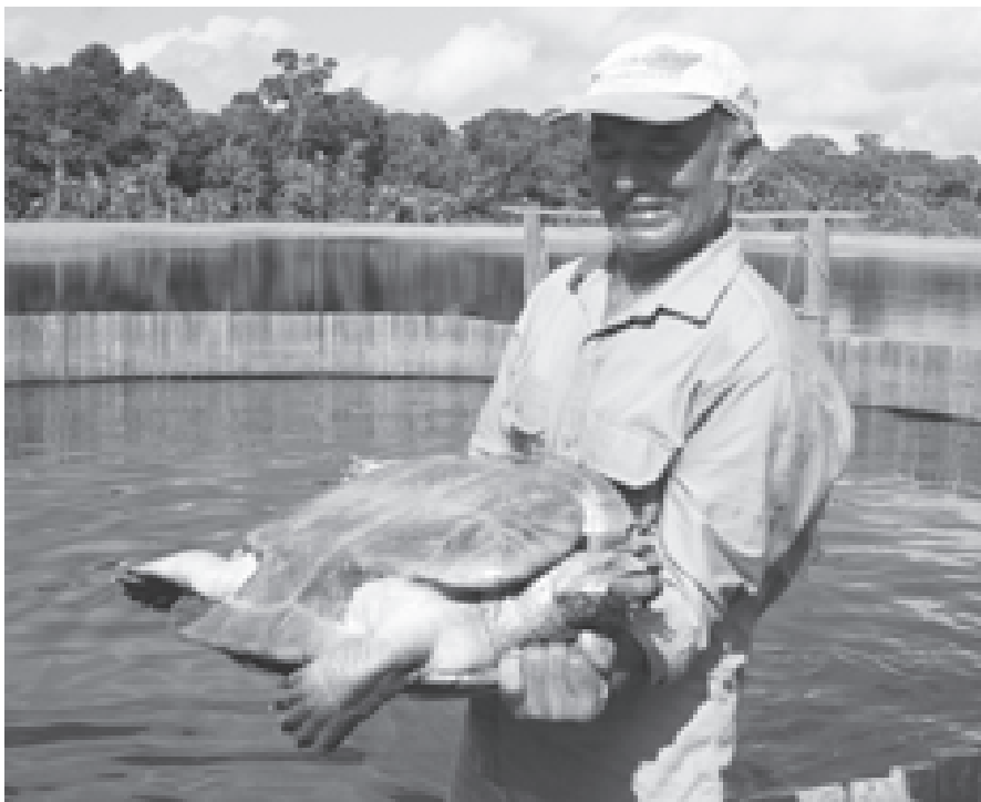
Criatório de tartarugas em Santarém (PA)

buindo para a adaptação da gestão dos processos, facilitando repasses aos projetos e garantindo fluxos constantes de recursos, o que resultou em baixíssimos índices de desvio de finalidade.