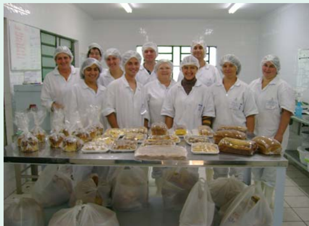
Curso de panificação artesanal

A implementação do PAA na região proporcionou a integração de várias instituições e organizações sociais na medida em que a Cooperfamiliar tem procurado envolvê-las nos debates a fim de construir propostas que atendam os interesses do conjunto da sociedade. Entre os principais parceiros envolvidos estão as prefeituras e secretarias dos municípios, a Emater (RS), o Conselho de Missão Entre Índios (Comin), o Sindicato dos Trabalhadores na Agricultura Familiar (Sintraf), o Movimento dos Pequenos Agricultores (MPA), a Associação de Pequenos Agricultores Agroecológicos de Tenente Portela (Apagro), a Associação Indígena de Produtos Orgânicos Sustentáveis Três Soitas, a Associação Indígena Agroartes de Produção Agropecuária e Artesanato, a Universidade Regional do Noroeste do Estado do Rio Grande do Sul (Unijui), o Banco do Brasil, a Cooperativa de Crédito Rural com Interação Solidária (Cresol), a Pastoral da Criança e igrejas. Além desses, destacam-se como parceiros e apoiadores a Prefeitura Municipal de Tenente Portela, o Ministério do Desenvolvimento Agrário (MDA), o Minis-