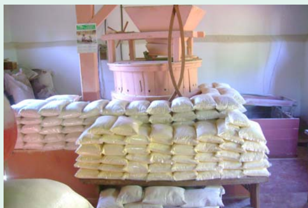
Industrialização artesanal de farinhas

tério do Desenvolvimento Social (MDS), o Ministério da Agricultura, Pecuária e Abastecimento (Mapa) e a Conab.