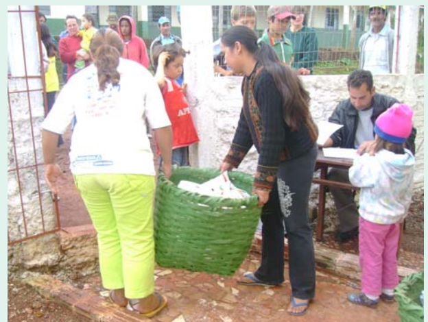
Distribuição de alimentos nos balaios

A Feira Livre do Produtor no município de Tenente Portela se iniciou na década de 1980 com o propósito de criar uma opção de comercialização para os produtos dos agricultores familiares. Desde então,