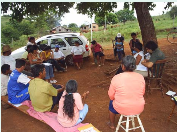
Reunião com Associação Indígena Três Soitas

mais de 780 toneladas produzidas por famílias de pequenos agricultores e, em especial, pela comunidade indígena. Com essa iniciativa, alterou-se a tradição de manter essas comunidades como receptoras de cestas básicas para transformá-las em produtoras e fornecedoras de gêneros alimentícios entregues a parcelas da população que não produzem seus próprios alimentos.