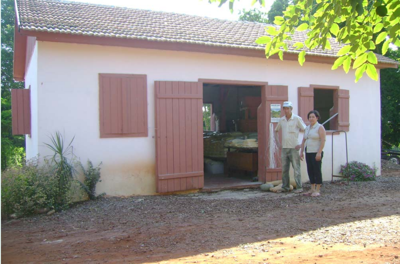
Moinho da família Kirsch revitalizado