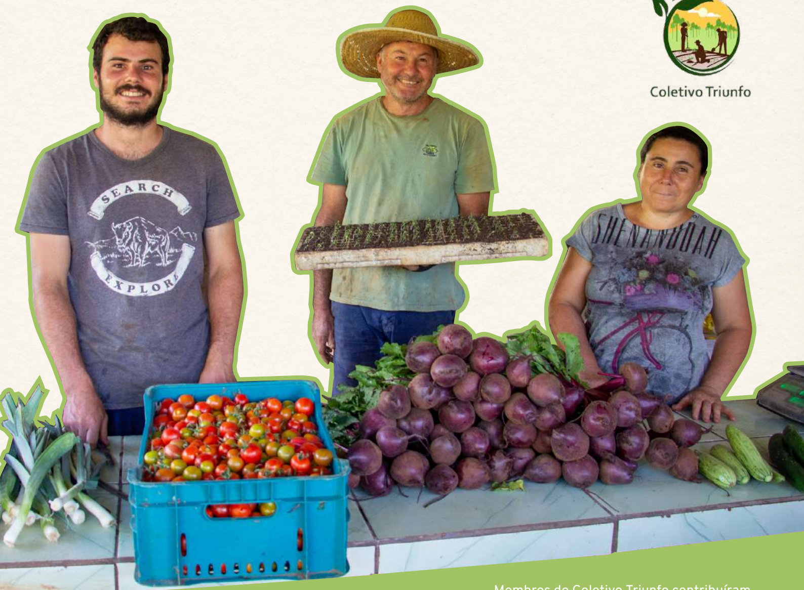
Membros do Coletivo Triunfo contribuíram com produção e logística das doações

Além das ações diretas com o público que estes parceiros atendem, as próprias organizações vem sendo incluídas gradativamente nas discussões sócio-políticas do território, como reuniões do Coletivo Triunfo, Feiras de Sementes e Seminários locais e territoriais.