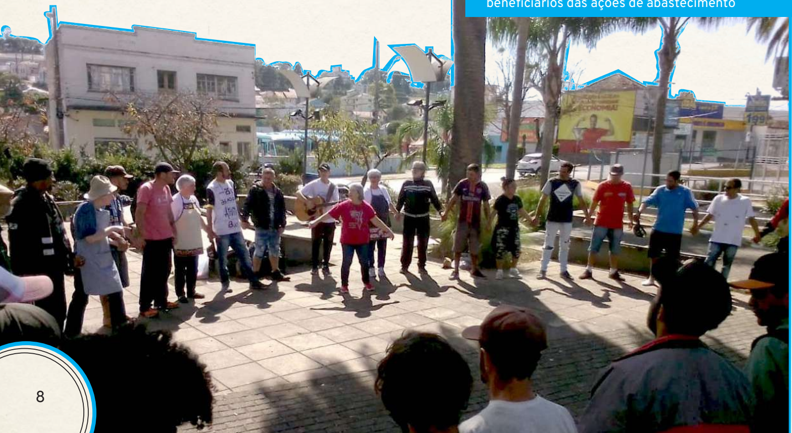
Dinâmicas criam elos entre voluntários e beneficiários das ações de abastecimento