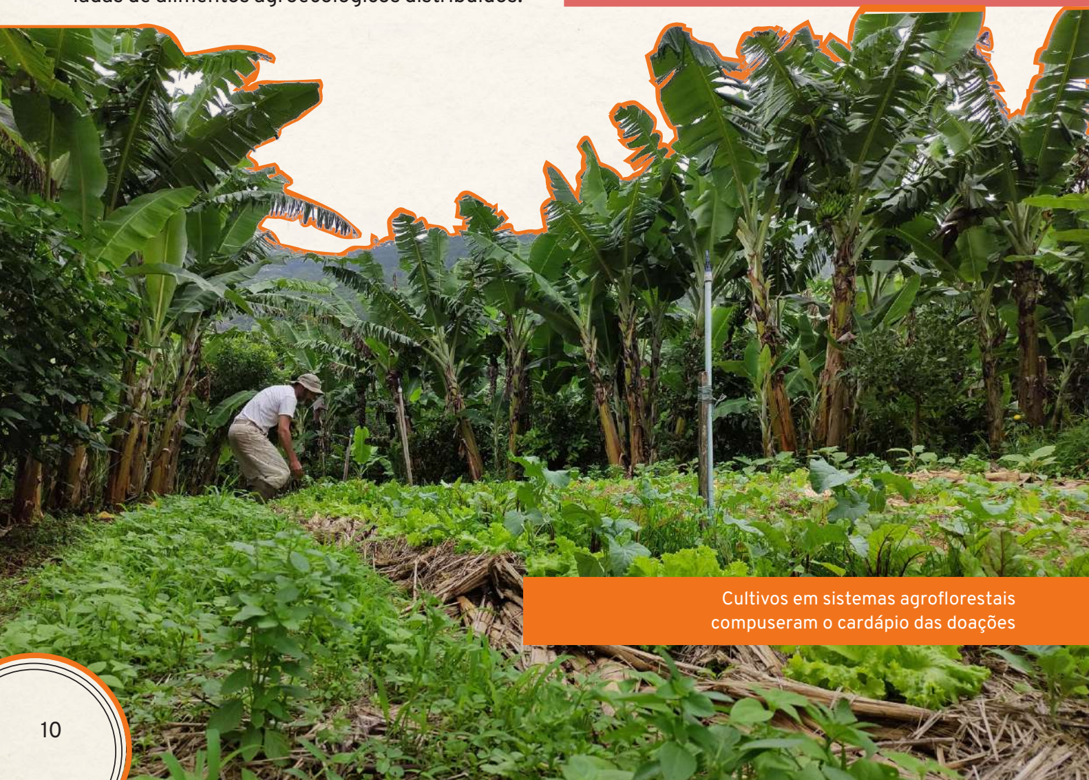
Cultivos em sistemas agroflorestais compuseram o cardápio das doações