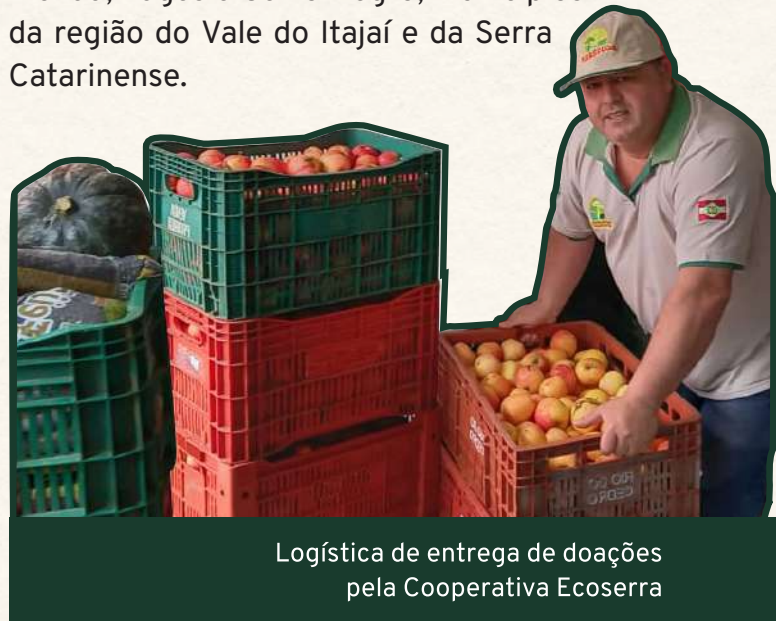
Logística de entrega de doações pela Cooperativa Ecoserra

Com experiência na operacionalização de programas públicos, o Centro Vianeí executou ainda durante a pandemia, em parceria com a Cooperativa Ecoserra, uma expressiva ação de doações através do Programa de Aquisição de Alimentos (PAA). O resultado chegou a 98,5 toneladas de alimentos agroecológicos distribuídos. Cerca de 60% desses alimentos foram produzidos por mulheres agricultoras. Os beneficiários recebedores desse projeto estão vinculados ao Programa Mesa Brasil, em Florianópolis, e às Assistências Sociais de Blumenau, Lages e Cerro Negro, municípios da região do Vale do Itajaí e da Serra Catarinense.