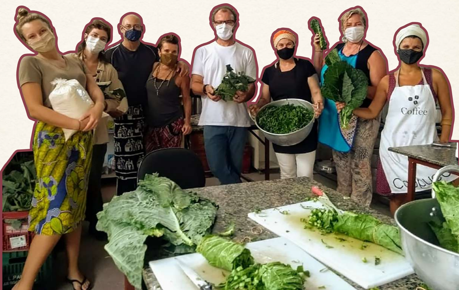
Processamento de alimentos doados na Cozinha Comunitária do Ribeirão da Ilha

Municipal e do Fórum Catarinense de Soberania e Segurança Alimentar e Nutricional (FCSSAN): “o movimento das cozinhas comunitárias permitiu mostrar que apenas um Restaurante Popular centralizado não é suficiente. Agora nossa luta é buscar a formalização desses espaços, discutir a importância do financiamento público para ações da sociedade civil e tê-los como parte integrante dos equipamentos públicos de Segurança Alimentar e Nutricional.” Com aproximadamente 100 mil pessoas em situação de baixa renda, a capital catarinense teve seu primeiro Restaurante Popular inaugurado apenas em julho de 2022, após uma década de pressão pelo Conselho Municipal de Segurança Alimentar e Nutricional Sustentável (COMSEAS) e movimentos sociais.