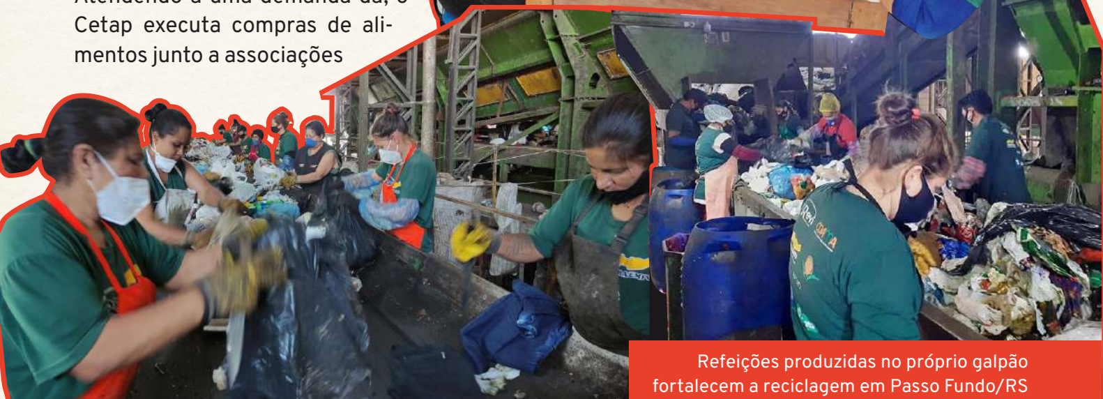
Refeições produzidas no próprio galpão fortalecem a reciclagem em Passo Fundo/RS

e cooperativas de agricultura familiar, ou diretamente com famílias agricultoras, para compor o cardápio de 2 refeições diárias preparadas na própria cooperativa e servidas aos 80 trabalhadores da reciclagem que atualmente compõem seus quadros.