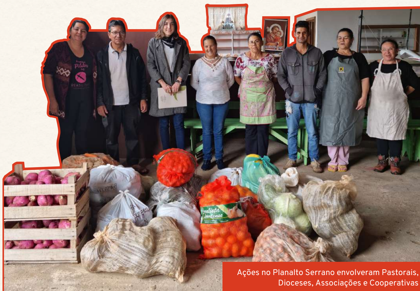
Ações no Planalto Serrano envolveram Pastorais, Dioceses, Associações e Cooperativas

As cestas foram entregues nos municípios de Lages, Curitiba e Cerro Negro, destinadas principalmente aos núcleos familiares chefiados por mulheres com perfil no Cadastro Único para Programas Sociais (CadÚnico) - além de serem na maioria mantenedoras de seus lares, grande parte delas enfrentam situações como serem mães solo, terem os maridos encarcerados ou acometidos por dependência química. Articuladas com a ação, foram realizadas 4 oficinas formativas de aproveitamento de alimentos.