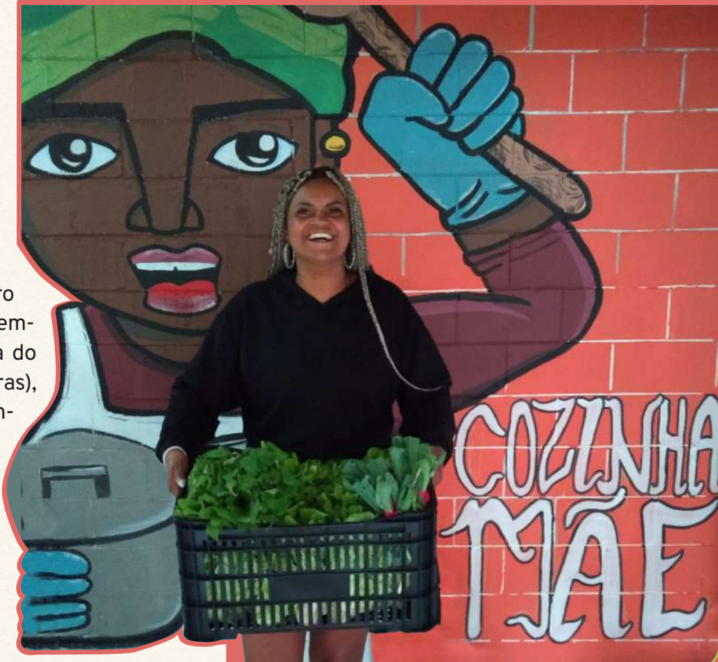
As iniciativas fortaleceram cozinhas comunitárias em Florianópolis

O abastecimento solidário no Litoral Catarinense forneceu alimentos para a complementação das refeições na Cozinha Solidária Rio Vermelho, Cozinha Solidária Ribeirão da Ilha, Cozinha Dona Hilda (Vila Aparecida), Cozinha Mãe (Bairro Monte Cristo), Cozinha do Templo Hare Krishna e Cozinha do Migrante (Bairro Capoeiras), espalhadas pelas regiões insular e continental de Florianópolis. Ao todo foram 22 variedades de alimentos, entre folhosas, temperos, grãos, frutas, raízes, hortaliças, bulbos, tubérculos, farinhas, ovos e leite. Estendendo-se pelo ano de 2022 e atualmente ainda em vigência, a iniciativa estima atingir 40 toneladas de alimentos agroecológicos distribuídos.