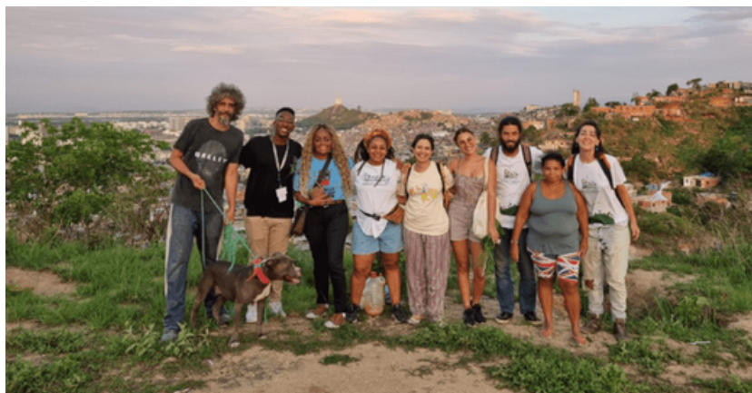
Figura 2: Grupo participante de visita de planejamento das tecnologias sociais no alto da favela Terra Prometida - Complexo da Penha