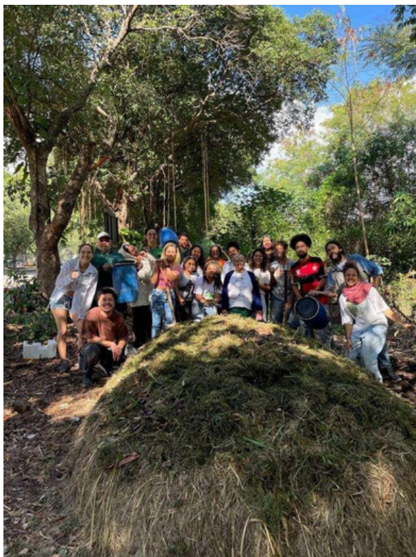
Figura 1: Curso de Saneamento Ecológico na Serra da Misericórdia em parceria com o grupo MUDA - Mutirão de Agroecologia UFRJ, CEM e Verdejar.

Foram realizados planejamentos de ações por território, com foco na implementação de tecnologias sociais, formações e a realização de intercâmbios entre os ALs, de acordo com as necessidades de cada local. As atividades realizadas foram: planejamento das tecnologias e desenho das hortas; mutirões; oficinas; cursos; seminários; visitas de intercâmbios; visitas de assessorias (Figuras 1, 2 e 3). Além das ações ocorridas em cada território, foram realizadas visitas intercomunitárias e proporcionada a participação em eventos de relevância no campo da agricultura urbana, como a Semana da Alimentação Carioca, o Festival Favela Sustentável, o Tira Caqui, o II Encontro Nacional de Agricultura Urbana e o Seminário de Tecnologias Sociais organizado pelo projeto (Figura 4).