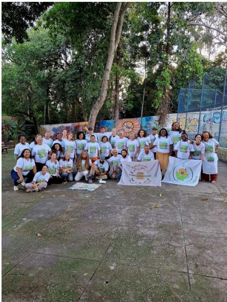
Figura 4: Seminário de Tecnologias Sociais