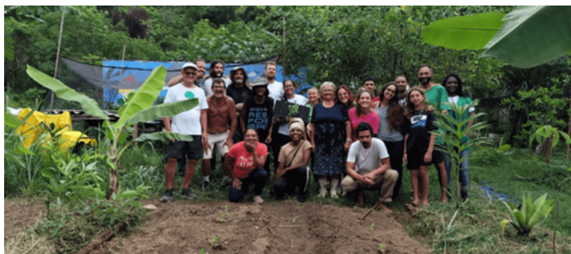
Figura 3: Mutirão em uma das Hortas apoiadas, no Complexo do Alemão